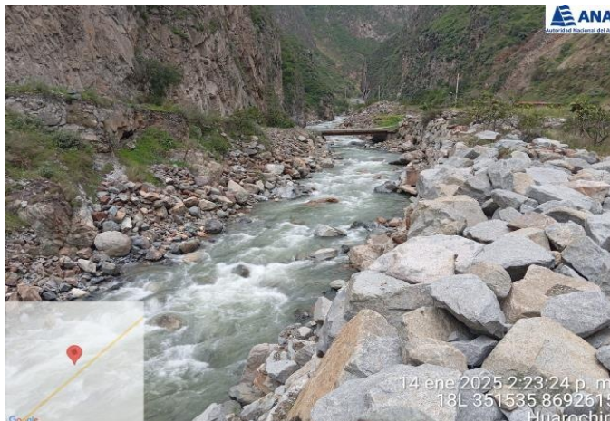
ZONA COLMATADA DEL RIO RIMAC